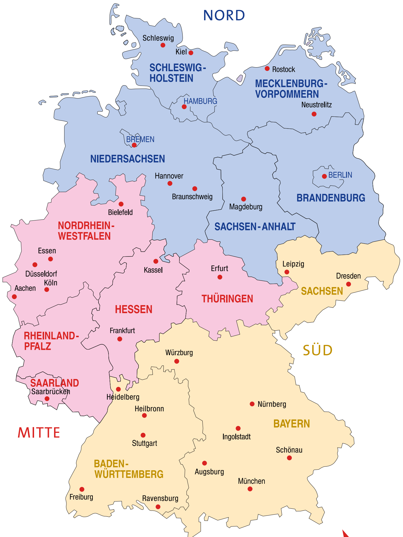
Regionalgruppen im BM